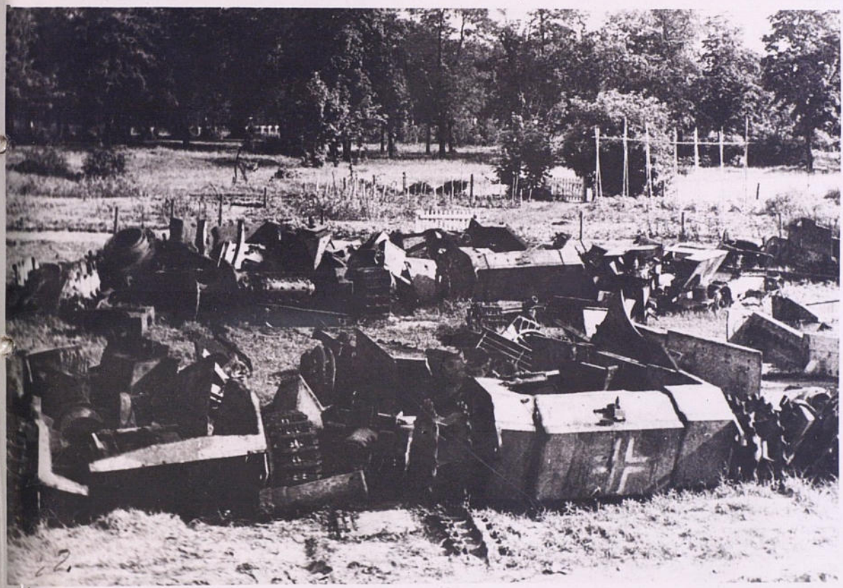
Нацистская военная техника превращена в металлолом.